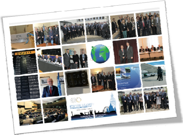
舍费尔女士 欧洲民用航空会议(ECAC)主席